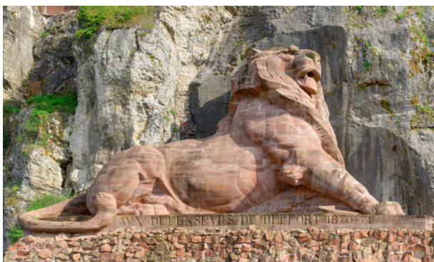
El león de Belfort del escultor francés Frédéric August Bartholdi. “...es Bartholdi, el que en los ijares de la fortaleza de Belfort clavó su león sublime. No se vive sin sacar luz en familiaridad con lo enorme. El hábito de domar da al rostro de los escultores un aire de triunfo y rebeldía.” 2