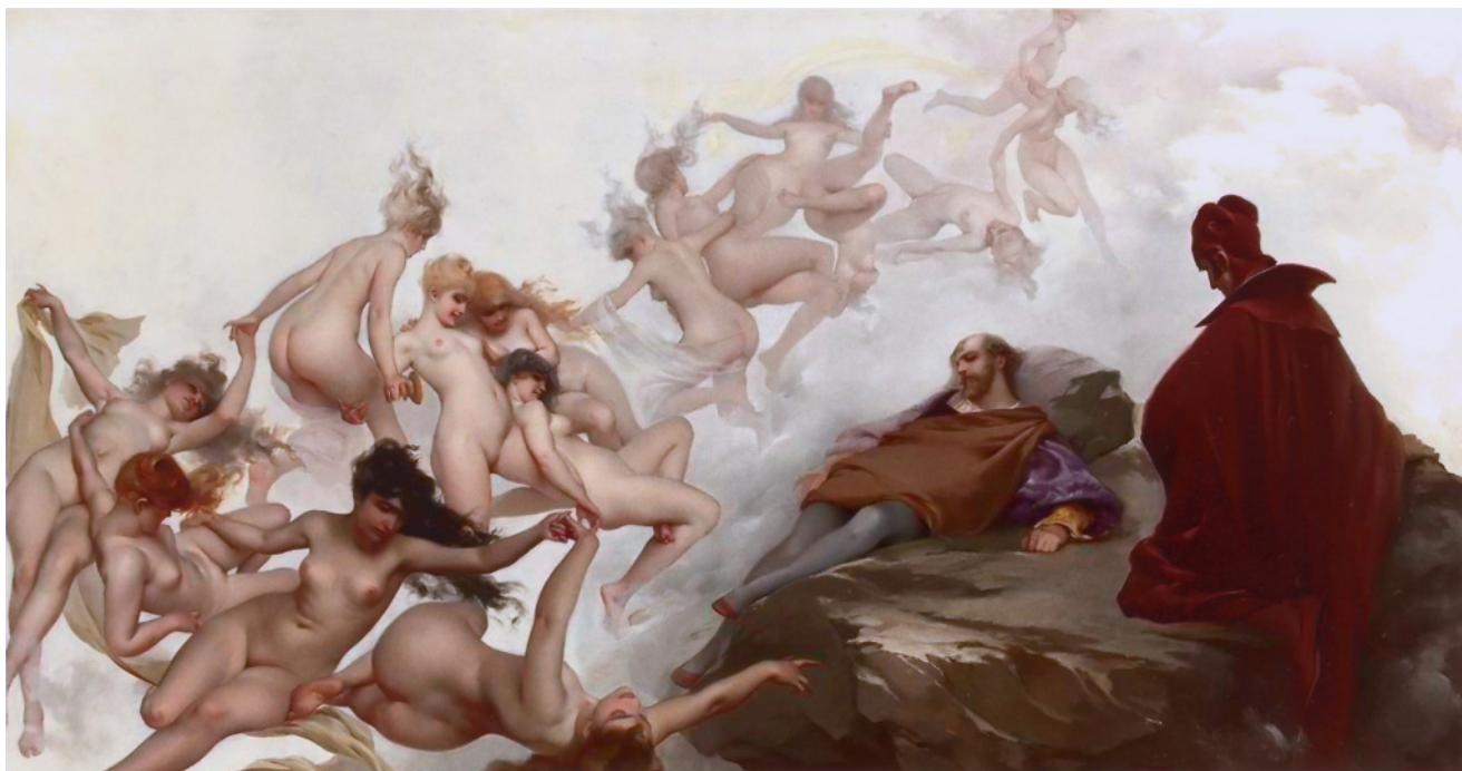
La visión de Fausto del pintor español Luis Ricardo Falero. “...el Fausto dormido de un pintor español, con un Mefistófeles arrodillado que parece un arriero alcarreño, orando con el rostro vuelto a tierra, cual si no quisiera ver cómo: en contorsiones estudiadas y volcánicas, cruzan el cielo lácteo, a manera de ráfaga, despeinadas y lívidas, en todos los abandonos del deseo, un montón de mozas ubérrimas y esbeltas...” 3

La principal fuente de obras plásticas en la obra martiana (44% del catálogo) proviene de sus crónicas de arte sobre exhibiciones y galerías, donde despliega toda su erudición crítica. La segunda fuente (22%) está en sus ensayos biográficos sobre artistas plásticos. Hay obras que se mencionan en textos periodísticos (18%), libros de su autoría (8%), apuntes personales (4%) y críticas literarias (1%). La valoración estética sobre obras plásticas, que define a la crítica de arte como un género, entre literario y académico e incluso periodístico, puede aparecer en cualquier escrito de José Martí, sin importar su extensión o contexto. Sus apreciaciones artísticas revelan un personalísimo estilo donde se conjuga el riguroso examen técnico de la obra con los juicios sobre su contenido y la impronta de su creador; y los sentimientos que su contemplación inspira.